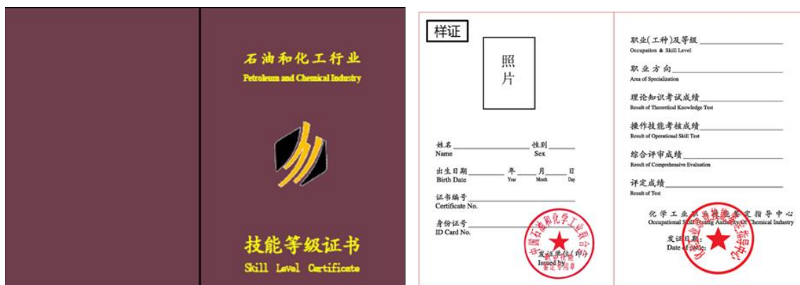
技师、高级技师版式